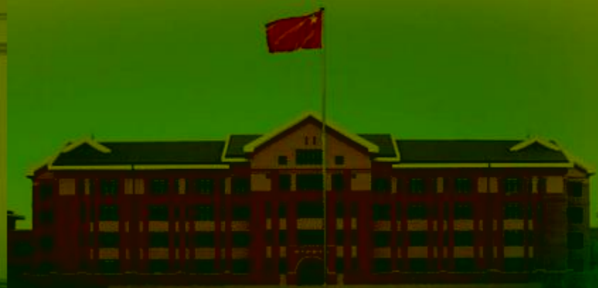
天津机电职业技术学院 TIANJIN VOCATIONAL COLLEGE OF MECHANICS AND ELECTRICAL ENGINEERING